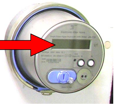
نام کنتور : INTECH (گرد) نحو قرائت :

کنتور دیجیتالی INTECH قابلیت نمایش : تاریخ ، ساعت ، کیلووات مصرفی و .... را دارا بوده که در صفحه دیجیتالی با فاصله زمانی ۸ ثانیه ، هر یک از اطلاعات فوق با مشخصه ای خاص قابل نمایش می باشد . مواردی که جهت قرائت کنتور مورد نیاز می باشد: